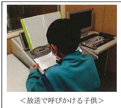
<放送で呼びかける子供>

環境・ボランティア委員会の5、6年生17名が中心となり、内閣府の「子供の未来応援国民運動」に連動した着なくなった子供服や靴の回収や「ユネスコ世界寺子屋運動」に連動した書き損じはがきの回収、そして「赤い羽根共同募金運動」への協力を全校放送やポスターの作成を通して行いました。