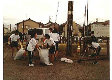
(ゴミや雑草の回収)