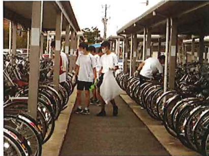
(駐輪場の清掃及び整頓)