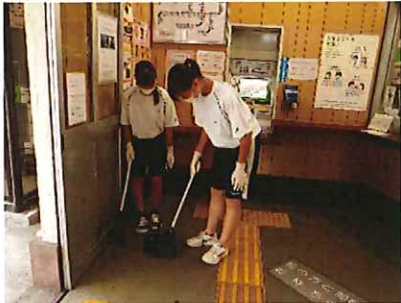
(大門駅待合室の清掃)

令和2年9月14日(月)15:50~17:00に、生徒会執行部と地域ボランティア委員会の生徒27名が参加し、大門駅待合室、トイレ、駐輪場、大門駅周辺の沿道の清掃活動を行いました。